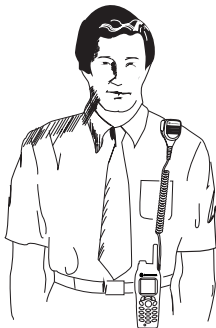
Abb. 1. Tragen des Zubehörs

Optimale Sendeleistung wird erzielt, indem Sie das Funkgerät und das RSM so tragen, dass das Zubehörkabel die Antenne nicht überkreuzt oder berührt. Funkgerät und RSM sind möglichst nicht zu weit voneinander entfernt zu tragen, so dass Schnur und Stecker nicht durch Ziehen belastet werden.